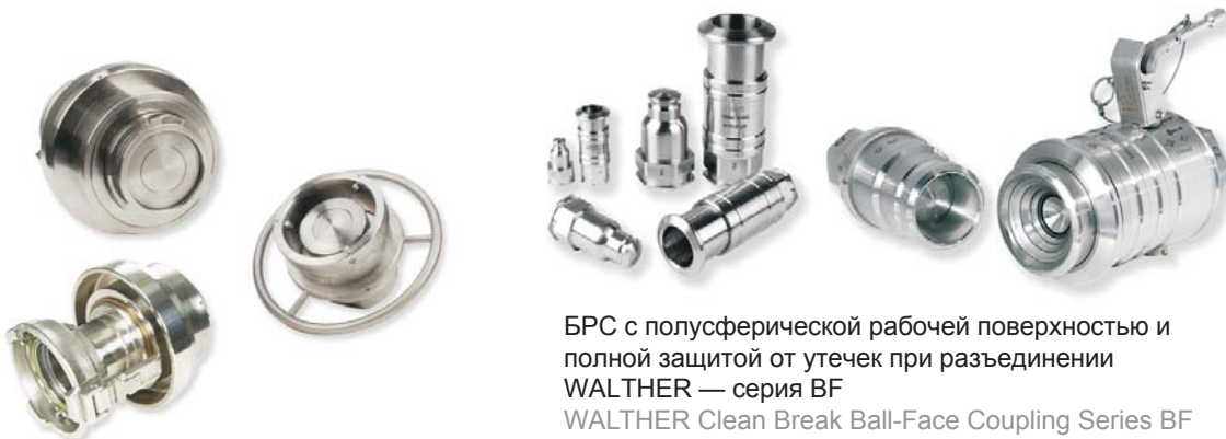
БРС с полусферической рабочей поверхностью и полной защитой от утечек при разъединении WALTHER — серия BF WALTHER Clean Break Ball-Face Coupling Series BF

Другие БРС с полной защитой от утечек при разъединении производства WALTHER-PRÄZISION для химических веществ: More clean break couplings of WALTHER-PRÄZISION in chemical applications: