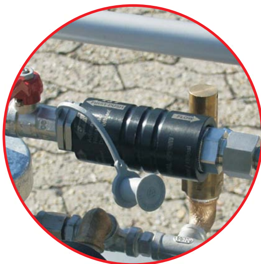
питающий баллон, здесь: с жидким азотом supply container, here: for liquid nitrogen